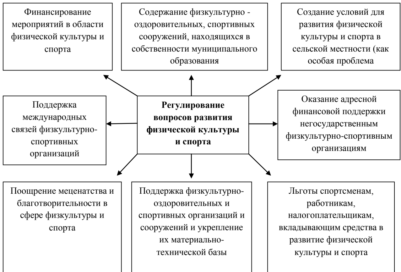
Схема 1- Направления регулирования сферы физической культуры и спорта

Регулирование развития физической культуры и спорта в городе Самара осуществляется по направлениям, которые представлены в схеме 1.