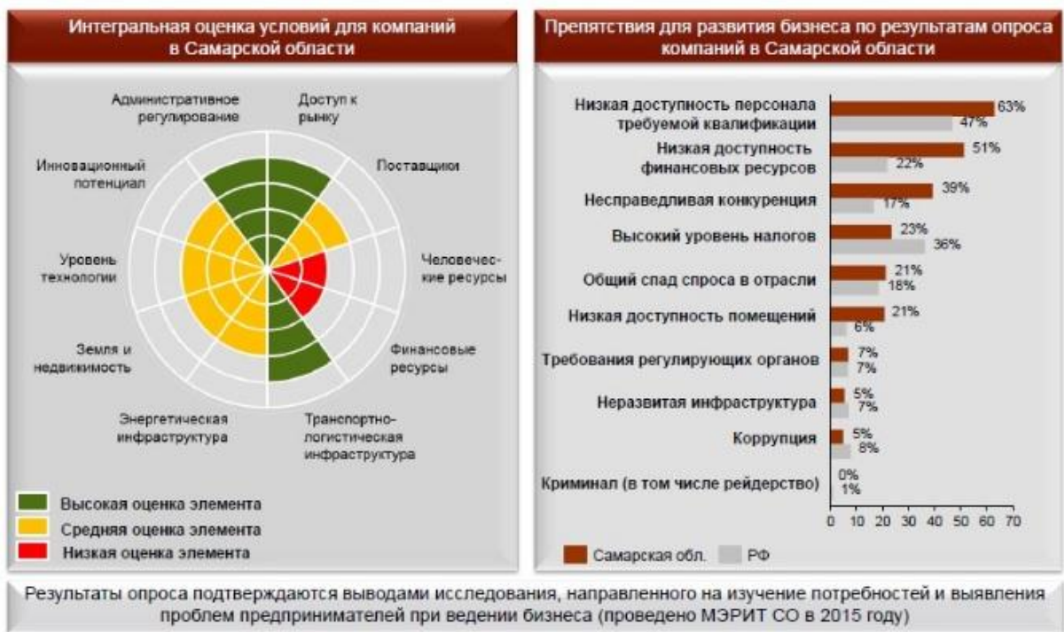
Рисунок 1 - Результаты опроса руководителей малых и средних компаний

По мнению бизнеса условия для развития предпринимательства в регионе являются в целом достаточно благоприятными. Однако критическими проблемами для большинства руководителей малых и средних компаний являются подбор квалифицированных кадров и низкая доступность финансовых ресурсов. Существуют значительные барьеры в процедурах получения разрешений на строительство и подключения к системам электро- и газоснабжения.