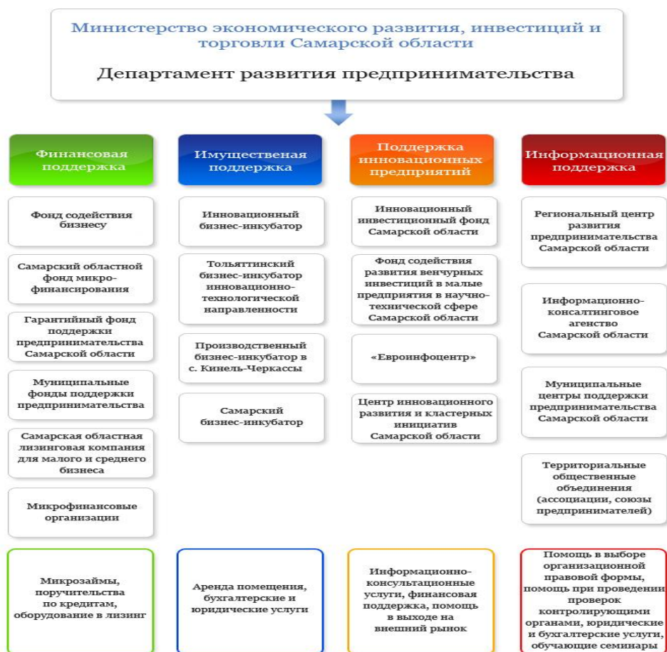
Рисунок 4 - Инфраструктура поддержки малого и среднего предпринимательства в Самарской области

На данный момент, активная государственная поддержка малому и среднему предпринимательству оказывается в рамках реализации программы «Развитие предпринимательства, торговли и туризма в Самарской области» на 2014-2019 годы»[17].