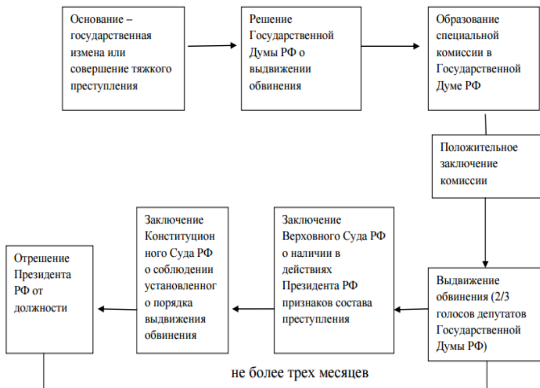
Схема 3. Процедура отрешения Президента РФ от должности

Относительно процедуры отрешения от должности Президента РФ есть ещё ряд не урегулированных вопросов. Так, Государственная Дума, принимая решение о выдвижении обвинения лишена, возможности осуществлять выемку необходимых документов, опрашивать свидетелей, проводить иные действия, что не дает возможность обосновать выдвинутое обвинение против Президента РФ. Конечно, всё это подкрепляется гарантией неприкосновенности Президента РФ и всё же, сам механизм принятия обоснованного решения о выдвижении обвинения ни чем тогда не подкреплен. Отсутствует и порядок вынесения Верховным Судом РФ заключения о наличии в действиях Президента РФ признаков преступления.