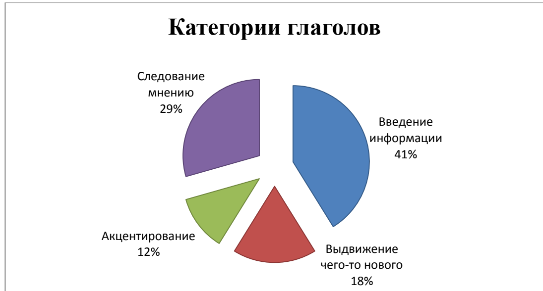
Рисунок 1 - Лексико-семантическое поле глаголов, вводящих чужое мнение в текст

Подводя итог исследования глаголов, используемых автором для введения новой информации, можно отметить, что наибольшее количество примеров относится к категории « введение информации », 41% (см. рис.1), что говорит о том, что автор предпочел не показывать своего отношения к исследованиям, подходе или научной теории, а просто констатировал факт. Категория « следование чьему-либо мнению » 29% (см. рис.1), стала второй по численности, исходя из того, что автор освещает в своей работе те теории или подходы, на которые он опирается и авторов, чью точку зрения он разделяет. Другой наиболее многочисленной категорией стала « выдвижение чего-то нового », 18%, ведь автор, исходя из проблематики научных текстов, вводит некую информацию в научный текст не просто так, а показывает читателю наиболее значимую информацию по теме его работы. Таковой может являться информация о появлении неких теорий, подходов, введение новой терминологии и т.д., на которые он опирается. Категория « акцентирование какой-либо мысли или положения » также характерна для научных текстов, 12% ведь она служит доказательной базой именно того, на что указывает автор, развивает его точку зрения.