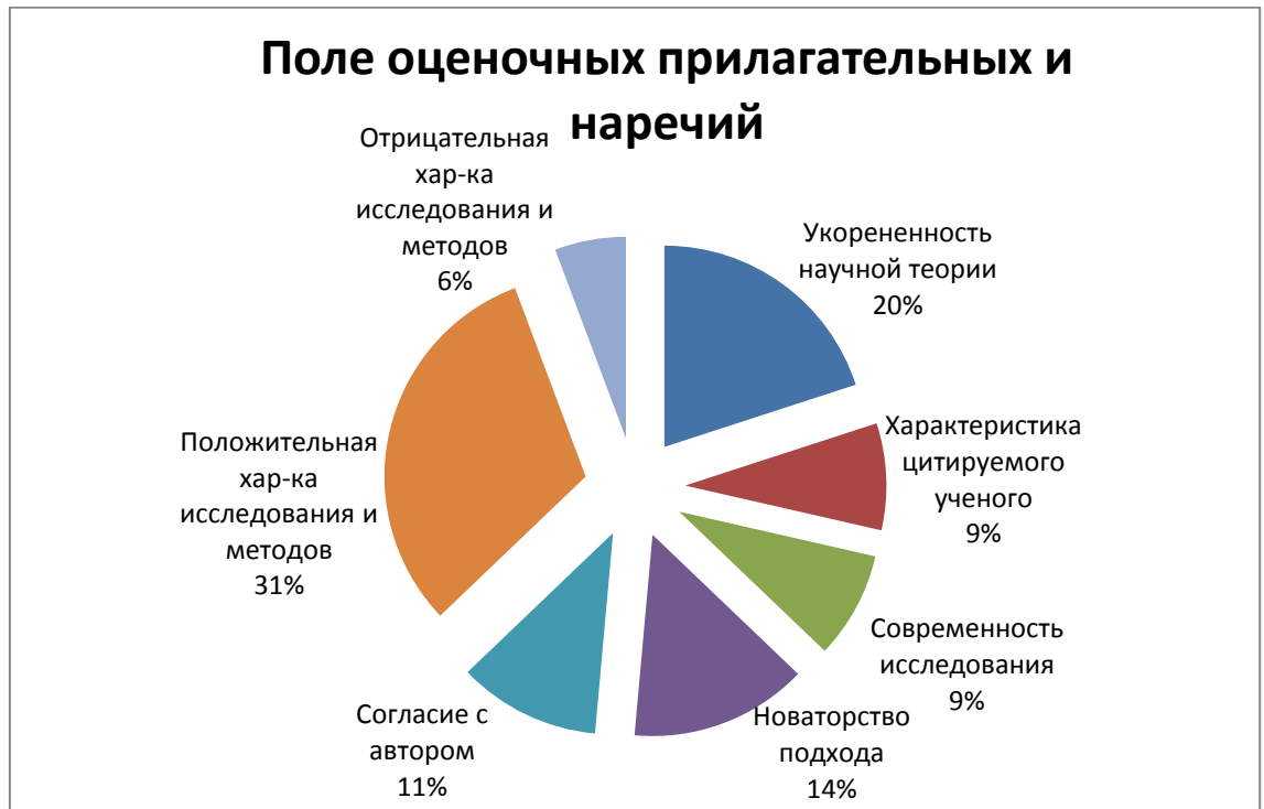
Рисунок 2 - Поле оценочных прилагательных и наречий

Данные примеры были размещены в диаграмму, которая помогла нам сделать выводы по полю оценочных прилагательных и наречий, используемых в качестве сигнального маркера введения чужого мнения (рис.2).